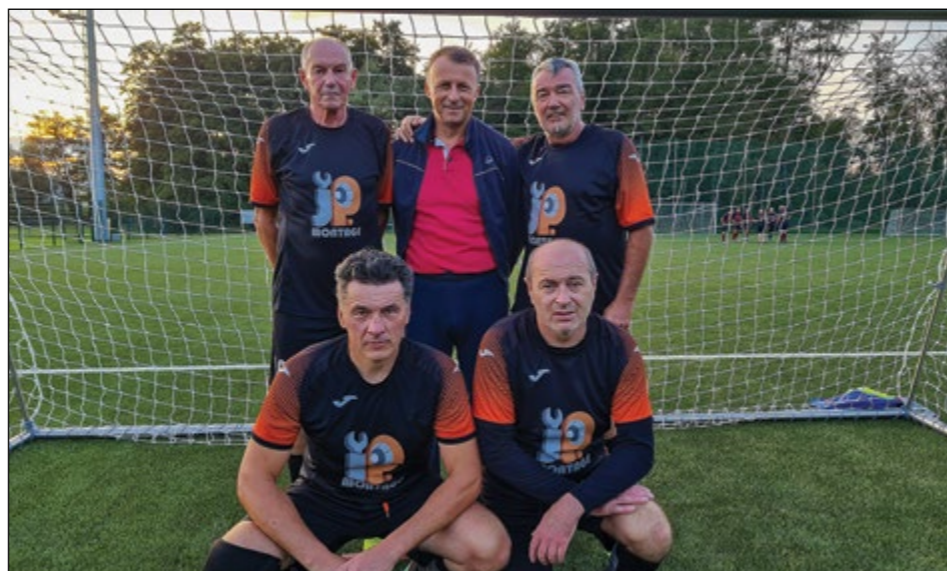
Skorba (veterani nad 50 let) – 3. mesto