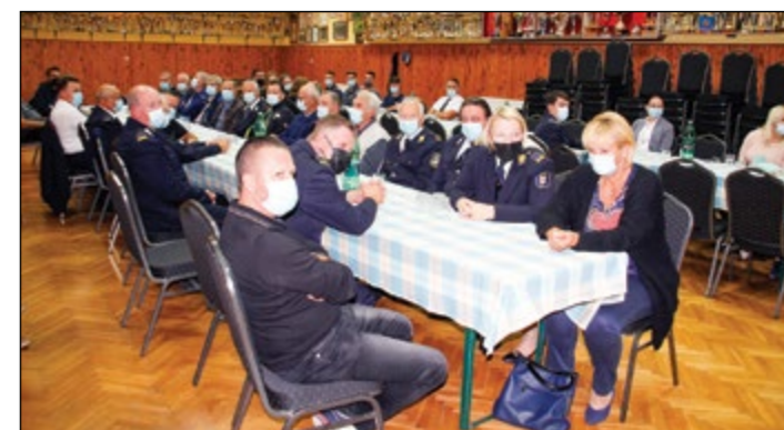
V gasilskem domu Hajdoše je bilo delovno srečanje članov PGD Hajdoše.

Nekateri od letošnjih gasilskih nagrajencev so prejeli značke za dolgoletno delo ter priznanja in potrdila o napredovanju.