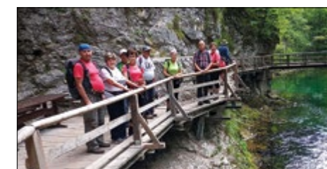
Na septembrskem pohodu skozi sotesko Vintgar