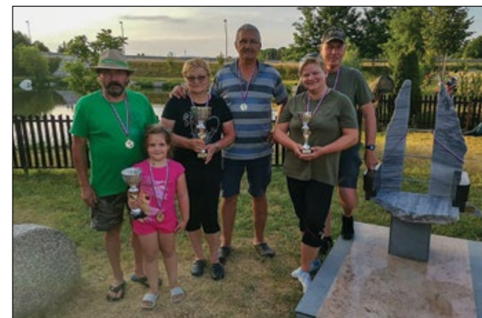
Najboljši pari na letošnji ribiški tekmi v Dražencih.