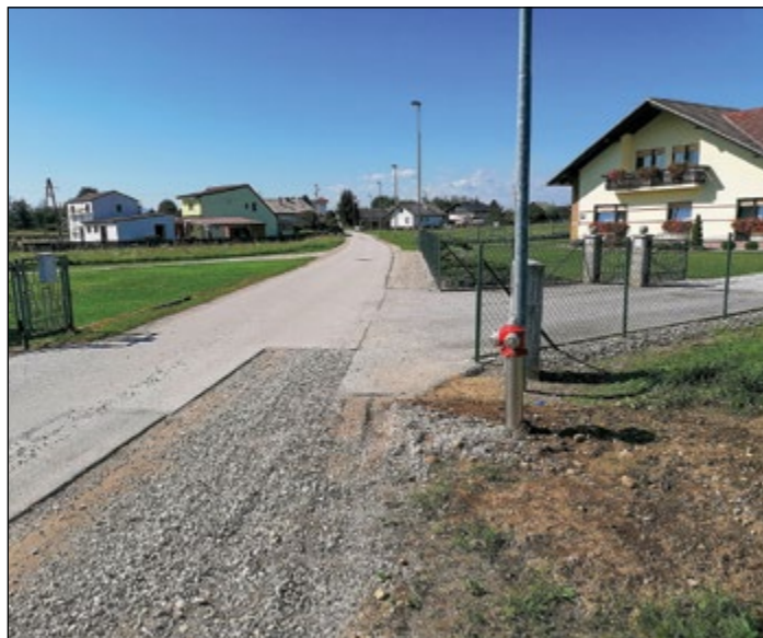
Izgradnja vodovoda in dveh hidrantov v naselju Draženci

S to investicijo so se izboljšali hidravlični pogoji (tlak) za obstoječe uporabnike, ki so do sedaj imeli probleme pri dobavi vode, nekaj gradbenim parcelam pa se bo omogočil priključek na vodovodno omrežje.