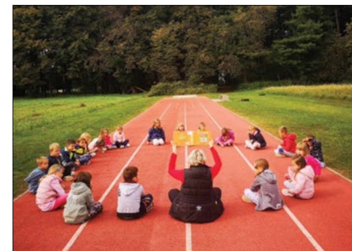
Otroci rdeče igralnice so s pomočjo jesenske pravljice pričarali čudovito jesensko vzdušje.