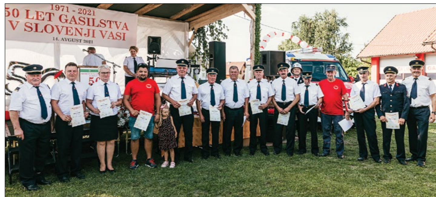
Skupinska fotografija letošnjih dobitkov jubilejnih značk in priznanja OGZ Ptuj