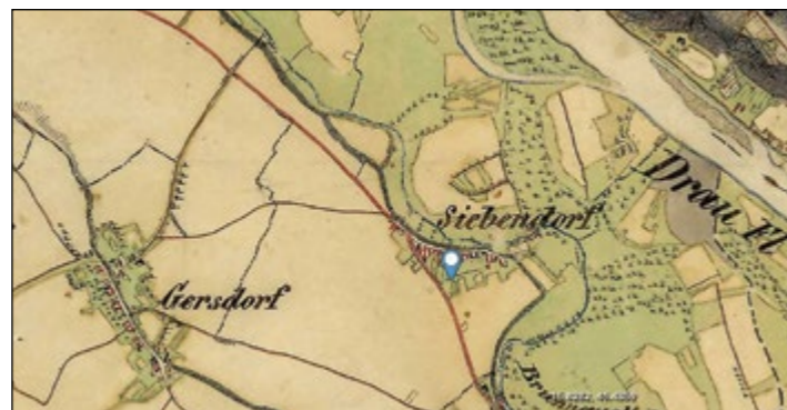
Izrez vojaške karte iz leta 1784

Hajdoše so vas, ki je postala znana daleč naokrog, ker je bila tukaj karting proga. Še bolj pa so jo naredili znano gasilci, ki tekmujejo in zmagujejo na številnih tekmovanjih v Sloveniji in sosednjih državah. S svojimi ekipami mladincev, članic A, članov in članic B pa so bili udeleženci osmih gasilskih olimpijad, na katerih so osvajali medalje. Osvojili so kar