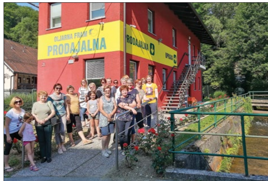
Na obisku v Oljarni Fram