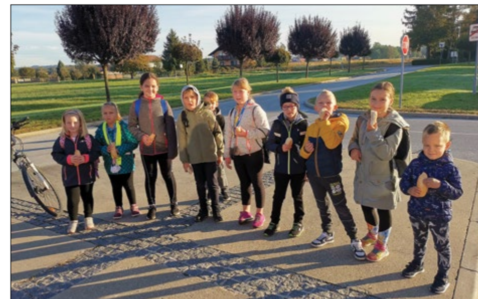
Malica za dober začetek hoje