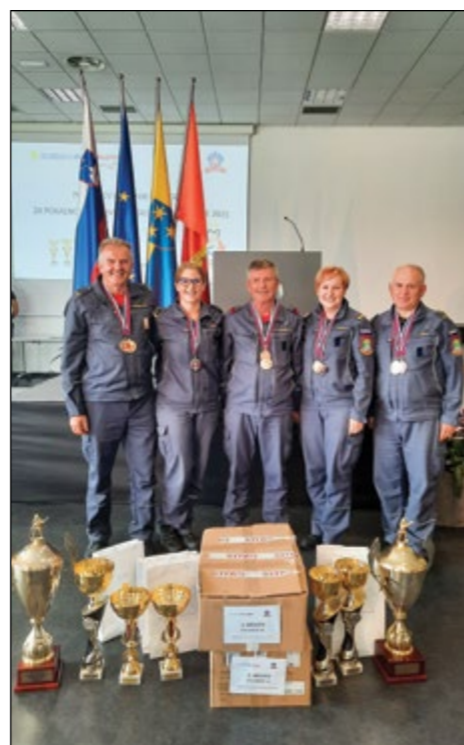
Utrinek s podelitve na Plenumu v Celju

Sledila je podelitev pokalov, medalj, priznanj in praktičnih nagrad za pokalno in državno gasilsko tekmovanje za leto 2021. Med prejemniki najvišjih gasilskih priznanj in prehodnih po-