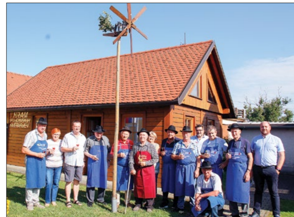
Za postavitev klopotca je bilo potrebnih nekaj pridih rok.