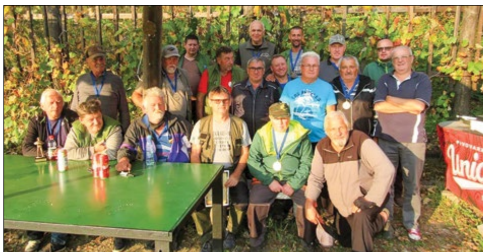
Skupinska fotografija udeležencev občinskega turnirja v ribolovu čtetvorke