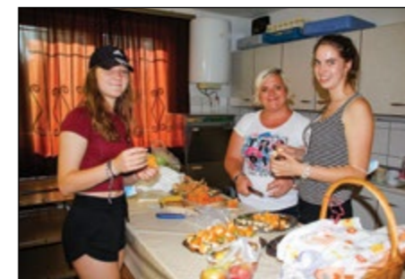
Počitniški utrinki z avgustovskih delavnic v Skorbi, kjer je bilo veliko zabave in ustvarjanja v različnih delavnicah.