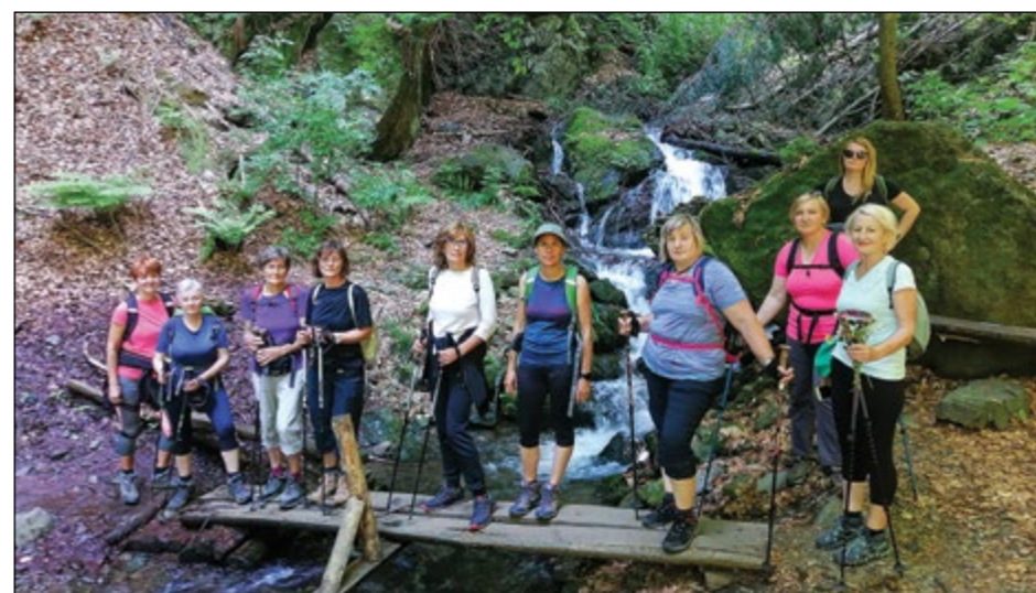
Iz Ruš do vrha Pečke