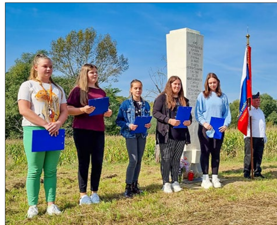
Na spominskem dogodku so se z verzmi in lepimi mislimi predstavili tudi učenci OŠ Hajdina.