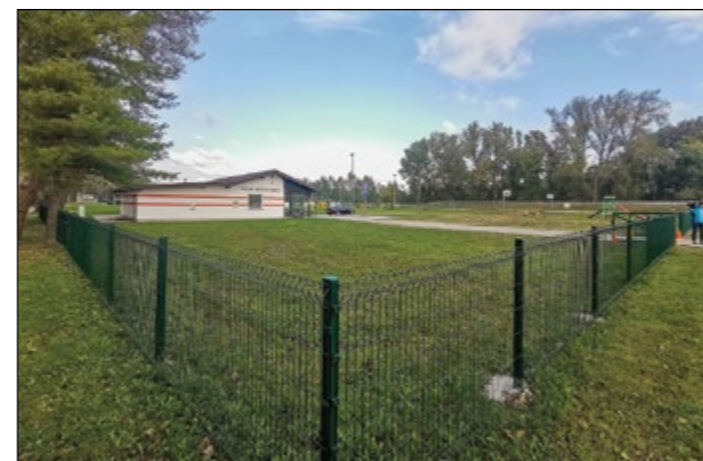
Ob vhodu v Športni park Hajdoše in ob njem že stoji nova panelna ograja.

V Športnem parku Hajdoše je bila letos poleti nabavljena in postavljena panelna ograja.