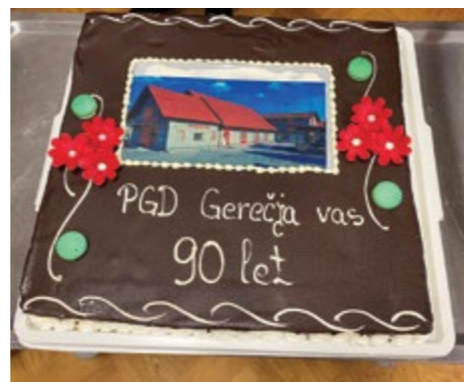
Utrinki s praznovanja 90-letnice PGD Gerečja vas

Ob tej priložnosti je bila v petek, 10. septembra, najprej organizirana večja operativna vaja na stanovanjski hiši v Gerečji vasi. Sodelovali so operativci iz vseh petih gasilskih društev v Gasilskem poveljstvu Občine Hajdina. V soboto, 11. septembra, pa smo se gasilci zbrali na svečani seji, ki je bila tokrat zaradi epidemioloških razmer izpeljana v nekoliko bolj okrnjeni obliki in zasedbi, a zato nič manj slavnostna. Povabilu na sejo so se odzvali pomembnejši gostje iz Podravske regije, Območne gasilske zveze Ptuj, Občine Hajdina, vaške skupnosti in predstavniki povabljenih gasilskih društev.