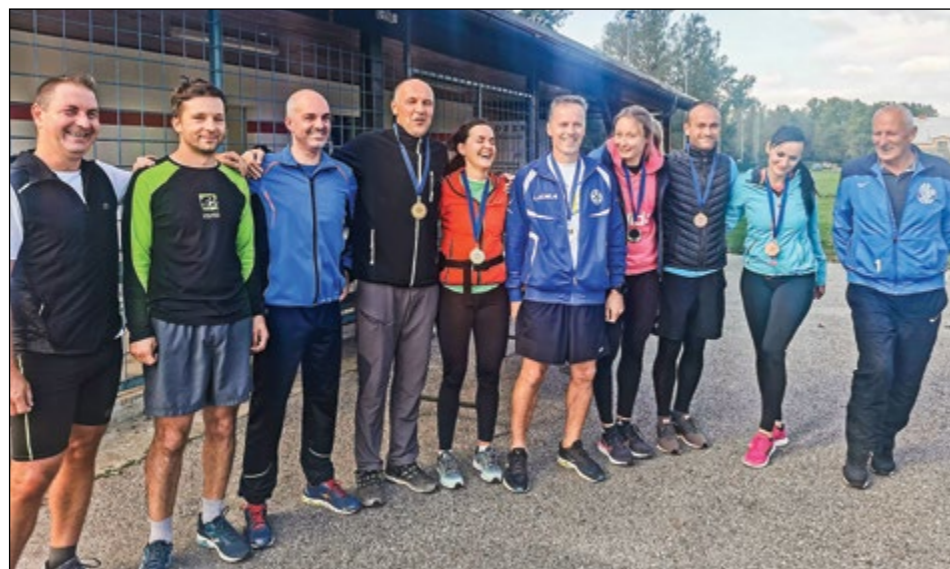
Start 3 – hajdinske desetke v Športnem parku Hajdoše