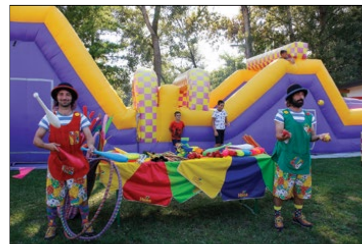
Za dobro voljo sta skrbela tudi brata Malek.