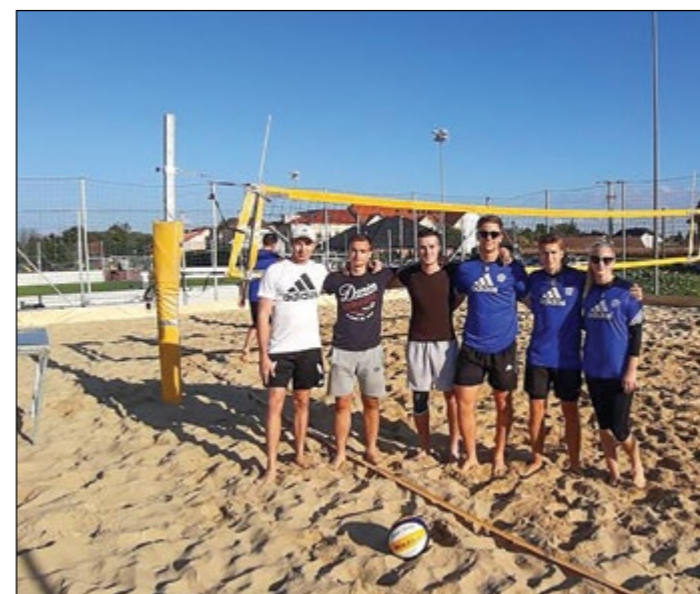
Ekipi Slovenje vasi in Gerečje vasi II