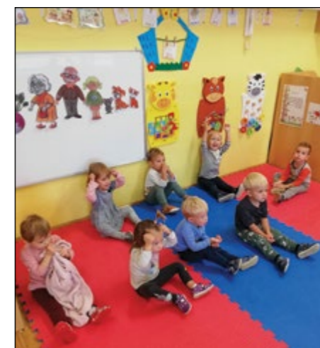
Otroci vijolične igralnice med sprostitveno dejavnostjo