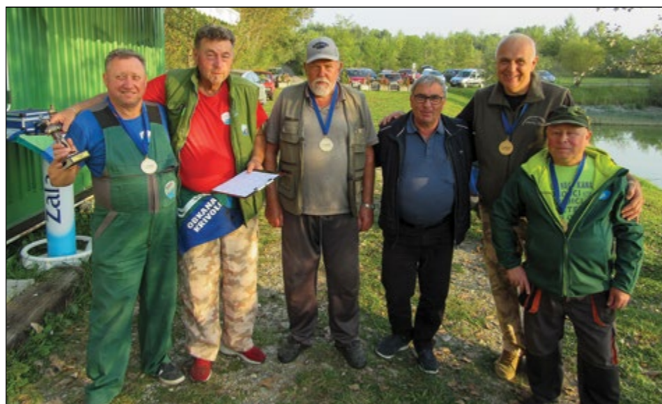
Zmagovalci Krivolovci Gerečja vas