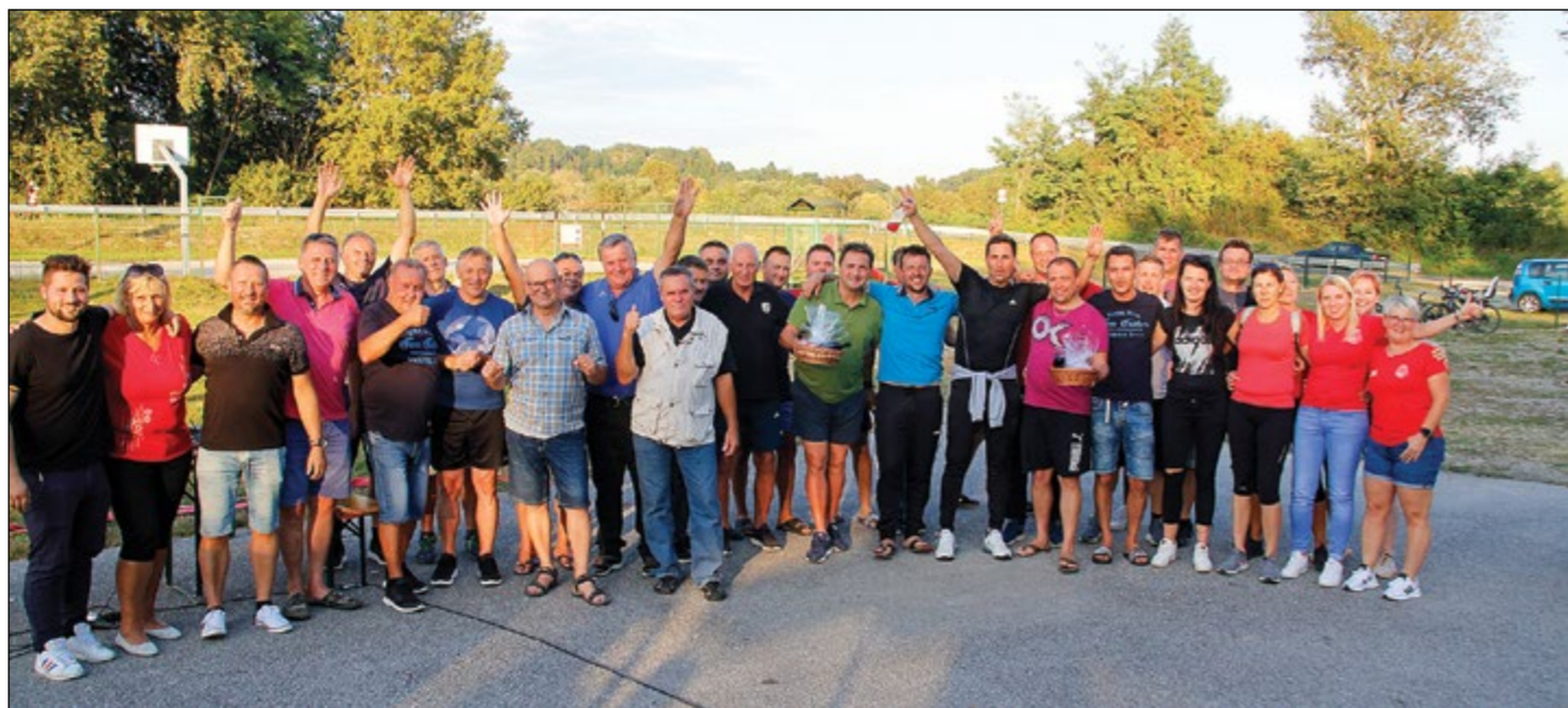
Skupinski posnetek vseh, ki so sodelovali na vaških igrah, ob njih tudi podeljevalci nagrad.

Ob gasilcih so vaščani in vaščanke zelo aktivni tudi v športnem društvu, društvu žensk in v kulturnem društvu. Vsem je znano, da vsa društva v vasi zelo dobro sodelujejo in skupaj pripravljajo številne prireditve, kjer si med sabo pomagajo.