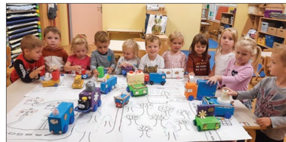
Otroci zelene igralnice so izdelali prevozna sredstva in se z njimi igralni na narisanim poligonu.