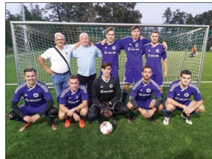
Gerečja vas (člani) – 1. mesto