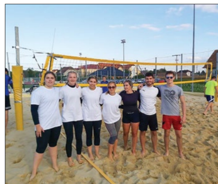
Ekipi Dražencev in Skorbe