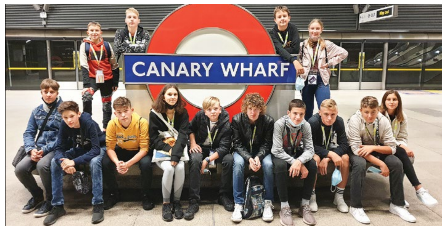
Sredi londonske poslovne četrti Canary Wharf