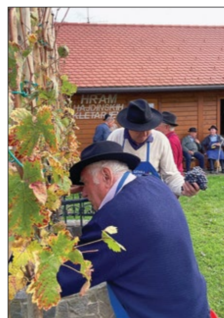
Potomka z Lenta je tudi letos dala dober pridelek.