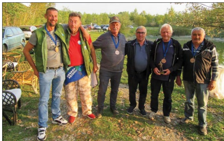
Tretje mesto je osvojila Skorba.