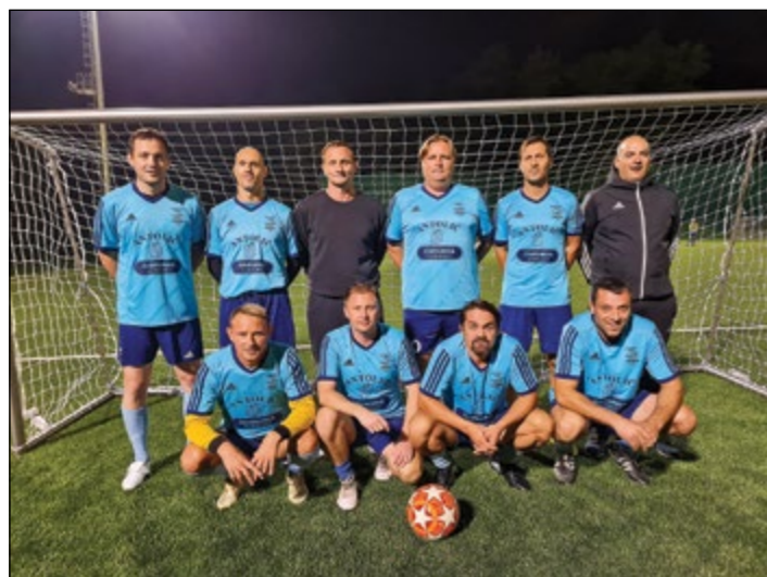
Skorba (veterani nad 35 let) – 2. mesto