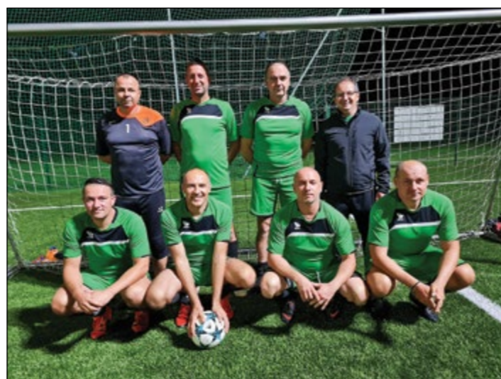
Draženci (veterani nad 35 let) – 5. mesto