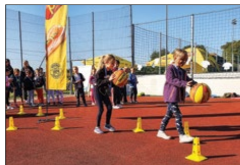
Prvošolki na košarkarskem poligonu