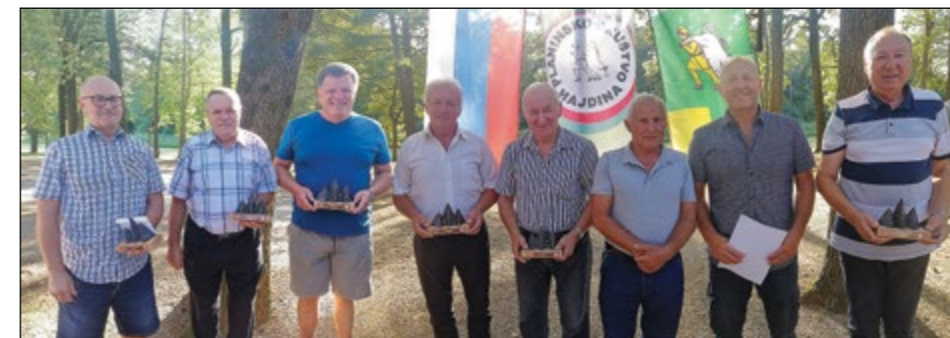
Utrinek z občnega zbora PD Hajdina, na katerem so bile podeljene tudi zahvale za 20 let dela v društvu.

Konec septembra se je manjša skupina 12 planincev PD Hajdina ponovno odpravila na krajši pohod na Sabotin. V jutranjih urah smo se zbrali na Pragerskem, kjer smo se z vlakom odpeljali do Ljubljane in nato do Jesenic. Po krajšem postanku smo se ustavili, popili kavico in čaj. Pot nas je nato vodila z vlakom do Solkana. Po izstopu smo pod vodstvom gospoda Voha nadaljevali pot po označeni južni, lažji poti proti vrhu. Pot se je strmo vzpenjala po kamniti stezi. Med kratkotrajno hojo po mulatjeri nas je popeljala na greben Sabotina, kjer smo opazili ruševine cerkve sv. Valentine. Vzpon smo nadaljevali po zelo razgibanem grebenu, s katerega se odpirajo lepi razgledi na Julijce, morje, reko Sočo in Sveto goro. Ob poti smo opazovali številne ostanke iz prve svetovne vojne s številnimi vojaškimi rovi. Za lažje premagovanje vzponov smo si pomagali z jeklenicami ob poti. Končno smo le prispeli na vrh Sabotina. Obiskali smo planinsko kočjo, v kateri smo se okrepčali. Pot je sledila nazaj po severni, težji kamniti poti do solkankega mosta in naprej na postajo. V poznih urah smo se z vlakom utrujeni vrnili proti domu, polni lepih doživetij.