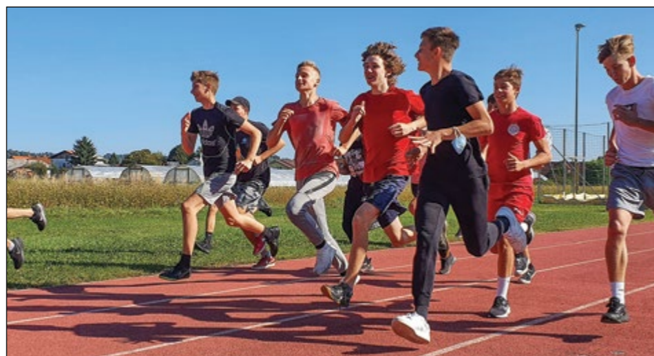
Devetošolci med množičnim tekom

K pestri vsebini športnega dne smo dodali še iskanje skritega zaklada po šoli, hojo po vrvi v gozdčičku, poligonško vadbo v zeleni učilnici na prostem (umetna trava), cirkuške vragolije na parkirišču in množičen tek otrok, ki ga je promovirala Atletska zveza Slovenije. Ob zaključku dneva