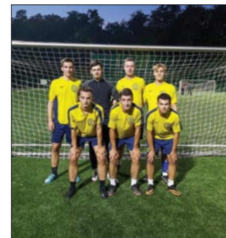
Hajdina (člani) – 2. mesto