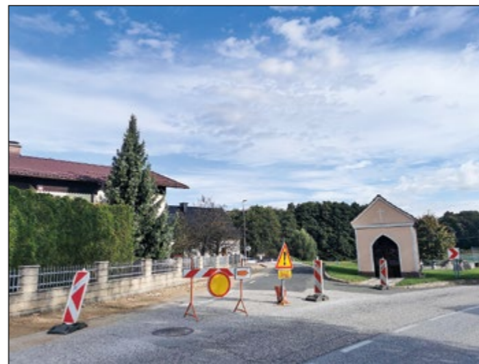
Na odcepu kapela–vrtinarstvo Zupanič na Sp. Hajdini bo kmalu spremenjen prometni režim. Promet bo potekal enosmerno v smeri kapele.

Med gradnjo in po njej bo na odcepu kapela–vrtinarstvo Zupanič spremenjen prometni režim, tako da bo promet potekal enosmerno v smeri kapele. Potek novega prometnega režima bo objavljen v medijih.