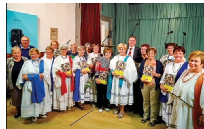
Najbolj zaslužnim za izid knjige sta se pridružila tudi oba župana.

tistim, ki so v rimsko kuhinjo verjele med prvimi, a sedaj niso več v aktivni kuharski postavi. In seveda tudi uredniškemu odboru.