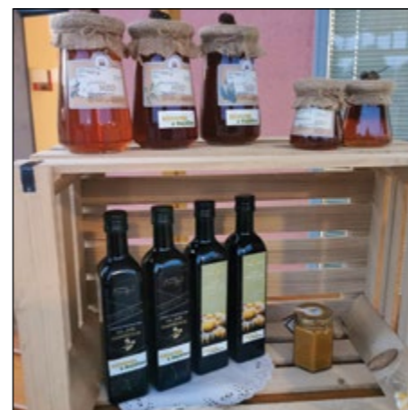
Takih in podobnih izdelkov z naših kmetij si v prihodnje občina Hajdina želi čim več. Dodatna spodbuda so tudi projekti v Turističnem društvu Mitra Hajdina.