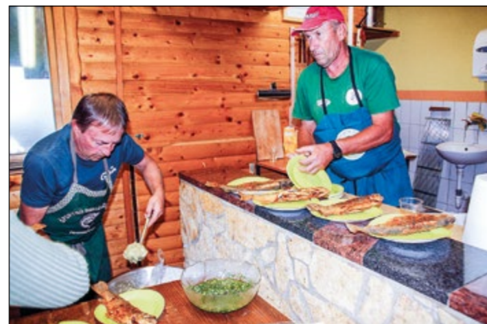
Člani Ribiškega društva Žejne ribice so domačinke lepo postregli s pečenimi postrvmi.