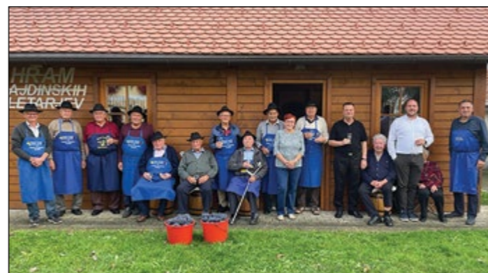
Letošnji trgači pri hramu kletarjev na Hajdini so delo dobro opravili.