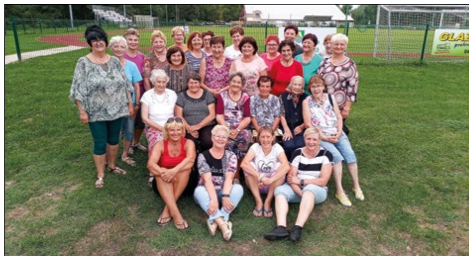
Hajdoške ženske so se letos poleti srečale na tradicionalnem aninem pikniku.

Tudi v Društvu žensk Hajdoše si članice niti v sanjah niso predstavljale, da bi jih doletel čas, ko se bo vse ustavilo in bo treba ubrati drugačno pot. Lani je bilo njihovo delo zelo okrnjeno, letos pa so se ob upoštevanju ukrepov in priporočil zdravstvene stroke vendarle srečale na tradicionalnem skupnem druženju.