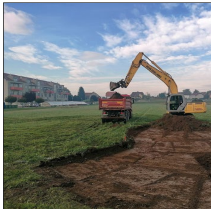
Na zazidalnem območju ob PSC Hajdina smo začeli izgradnjo komunalne infrastrukture.

nega območja, s čimer se bo prihodnjim investitorjem omogočila nemotena gradnja stanovanjskih objektov.