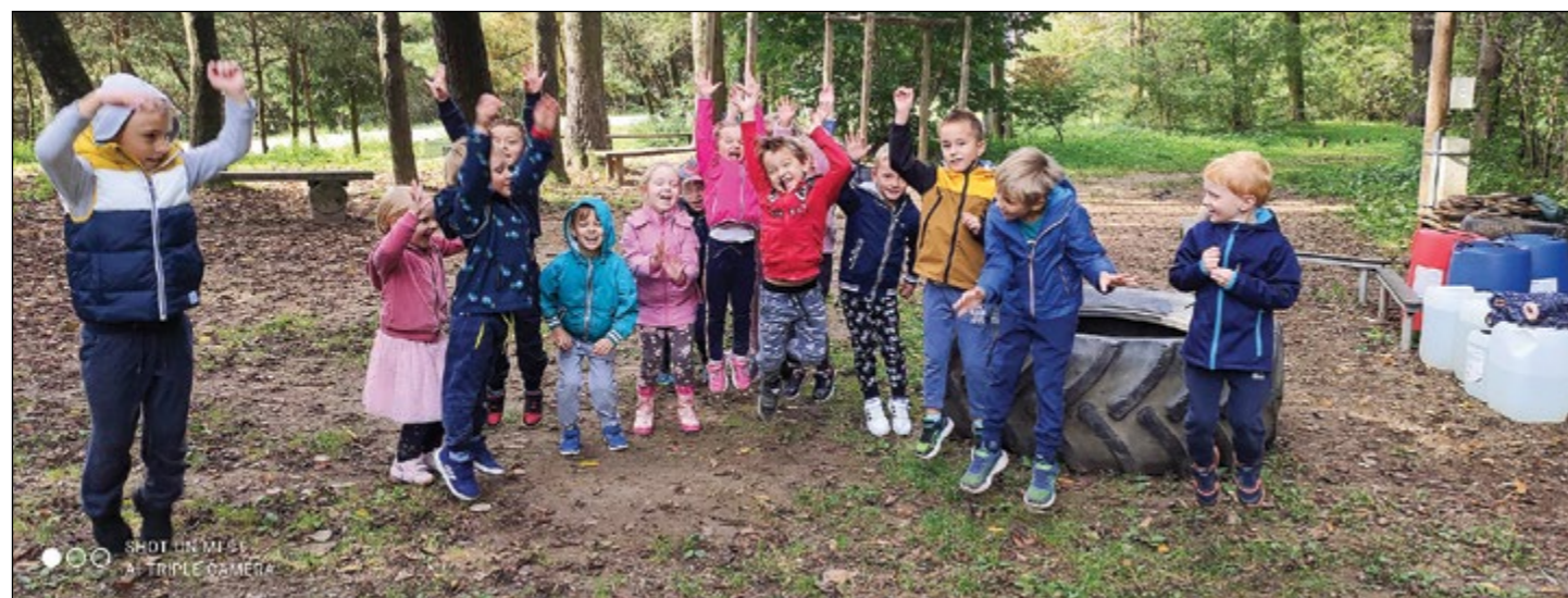
Iz našega gozdička se sliši vesel otroški smeh bele igralnice, kjer smo obeležili prvi jesenski dan.