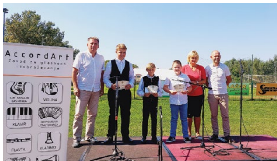
Najboljši harmonikarji v mlajši kategoriji do 14 let in podeljevalci nagrad