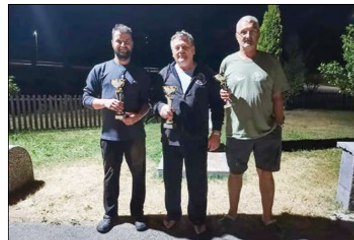
Najboljši trije ribiči na nočni junijski tekmi v Dražencih.