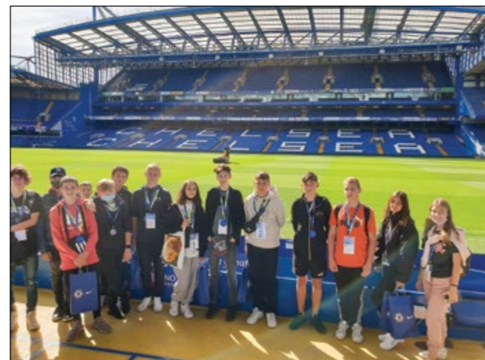
Na stadionu FC Chelsea