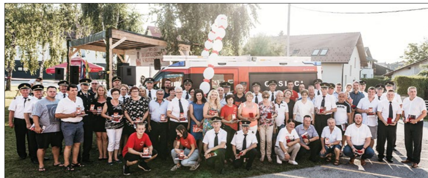
Botri novega gasilskega vozila slovenjevaških gasilcev in vsi tisti, ki so prejeli spominsko zahvalo društva.