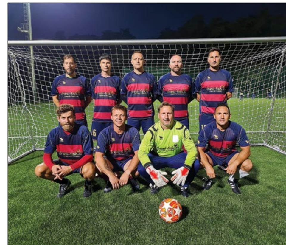
Hajdoše (veterani nad 35 let) – 1. mesto