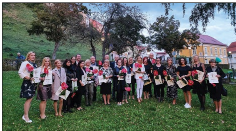
Letošnji nagrajenci – prejemniki plakate in priznanja dr. Franja Žgeča.

Med prejemniki so tudi pedagoški delavci iz OŠ Hajdina in OŠ Breg. S spleta smo povzeli fotografijo prejemnikov in z njeno objavo iskreno čestitamo vsem, ki so bili vsaj simbolično nagrajeni za njihovo dolgoletno pedagoško predanost mlademu rodu.