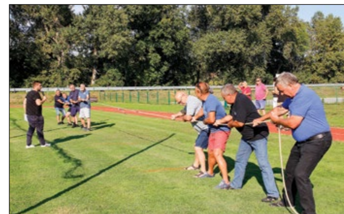
Na vaških igrah se je pomerilo osem ekip in vzdušje je bilo enkratno.

Sledile so vaške igre, na katerih se je pomerilo osem ekip. Preizkusili so se v vleki vrvi, v skokih v vrečah in premagovanju poligona na napihljivih igralih. Vse je potekalo v pravem tekmovalnem duhu in prijetnem vzdušju. Na kon-