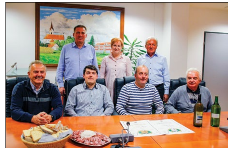
Nagrajenci na ocenjevanju Vino Ptuj in Festivalu Dobrote slovenskih kmetij na sprejemu v prostorih občine Hajdina