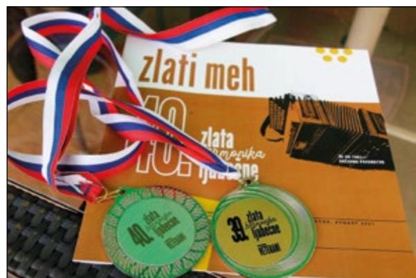
Alojzovi medalji in priznanji za sodelovanje na tekmovanju v igranju na diatonično harmoniko.