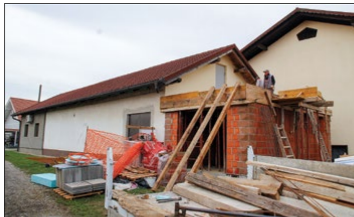
V začetku oktobra so se začela gradbena dela pri ŠD Skorba, kjer bo izgrajen prizidek h garderobam športnega objekta.