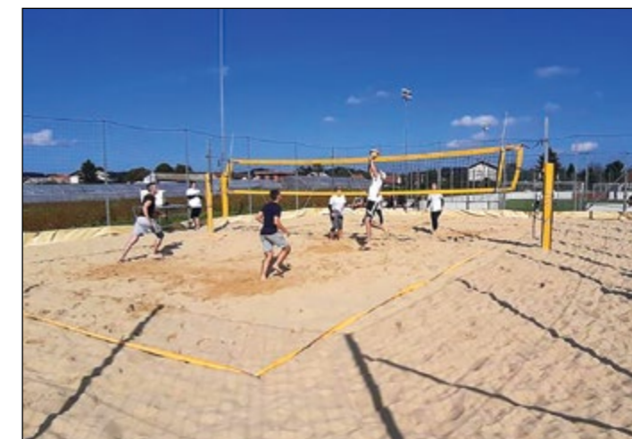
Utrinek z igrišča ...