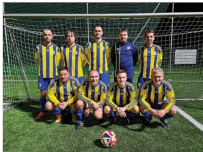
Hajdina (veterani nad 35 let) – 3. mesto