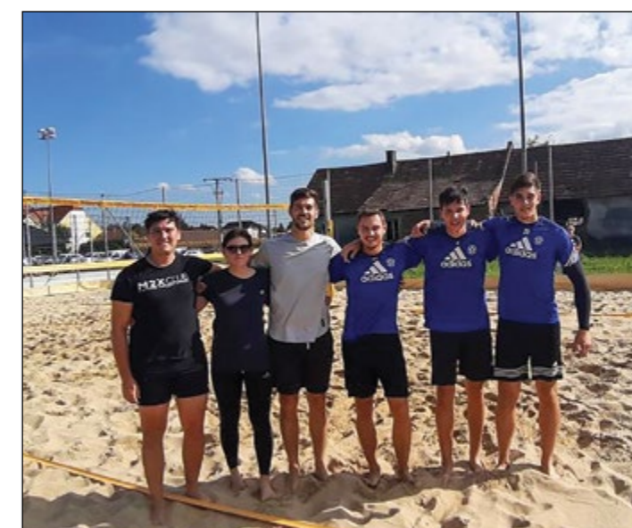
Ekipi Hajdoš in Hajdine