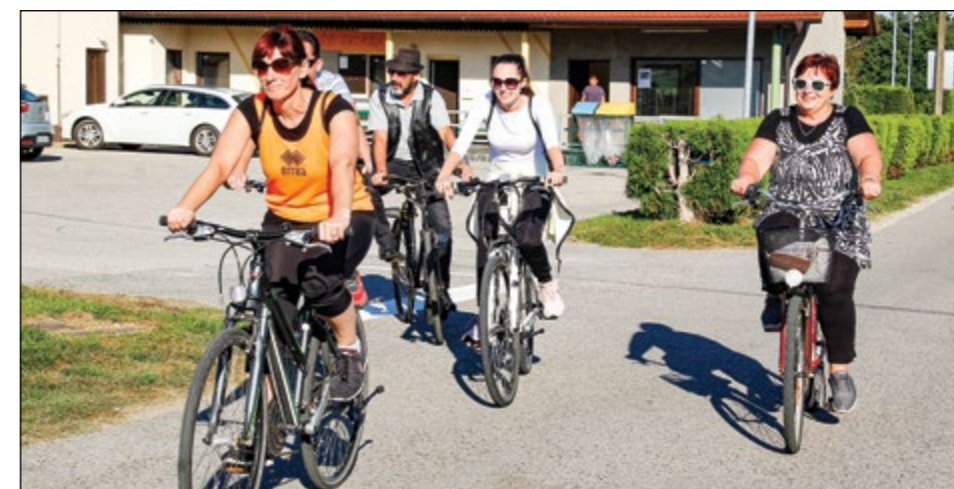
Letošnji kolesarski utrinki iz Skorbe, kjer je bil start kolesarskega trima.