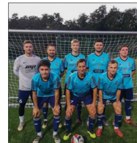
Skorba (člani) – 5. mesto