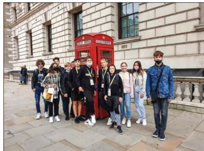
Hajdinski osnovnošolci med raziskovanjem londonskih ulic

V hotelski restavraciji nas je čakal odličen angleški zajtrk. Ko smo se najedli, smo se s podzemno odpravili do poslovne četrti Canary Wharf in se z značilnim londonskim avtobusom »doubledeckerjem« zapeljali do reke Temze, ki smo jo prečkali pod zemljo. Na drugi strani smo si ogledali observatorij in ničelni poldnevnik, ki deli Zemljo na vzhodno in zahodno poloblo v Greenwichu. Nato smo se iz Greenwicha z ladjico odpeljali po reki Temzi do znamenitega Tower Bridga. Videli smo tudi najvišjo stavbo v Evropi – Sharp. Tower Bridge smo tudi prečkali, na drugi strani pa smo si ogledali Shakespeare Theater in se sprehodili do Milenium Bridgea, ki smo ga prečkali, da smo si lahko ogledali St. Paul's Cathedral. Sprehodili smo se tudi