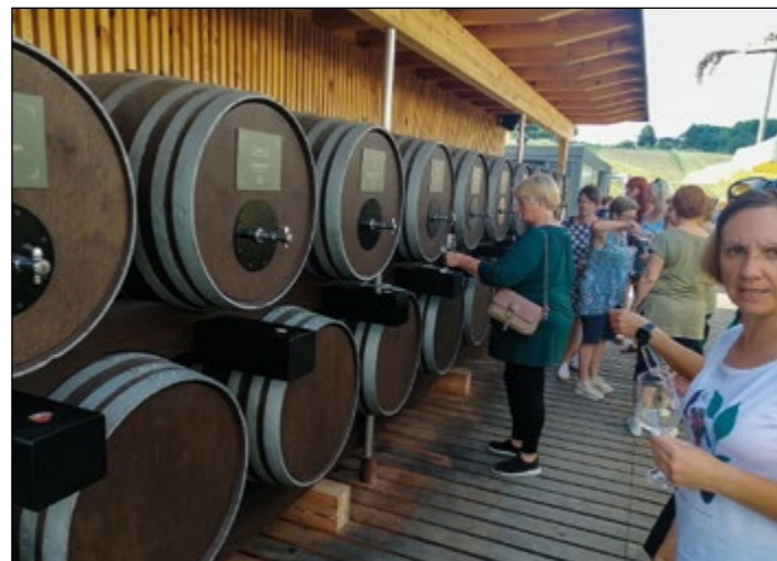
Obiskali so tudi fontano vin v Vodolah.