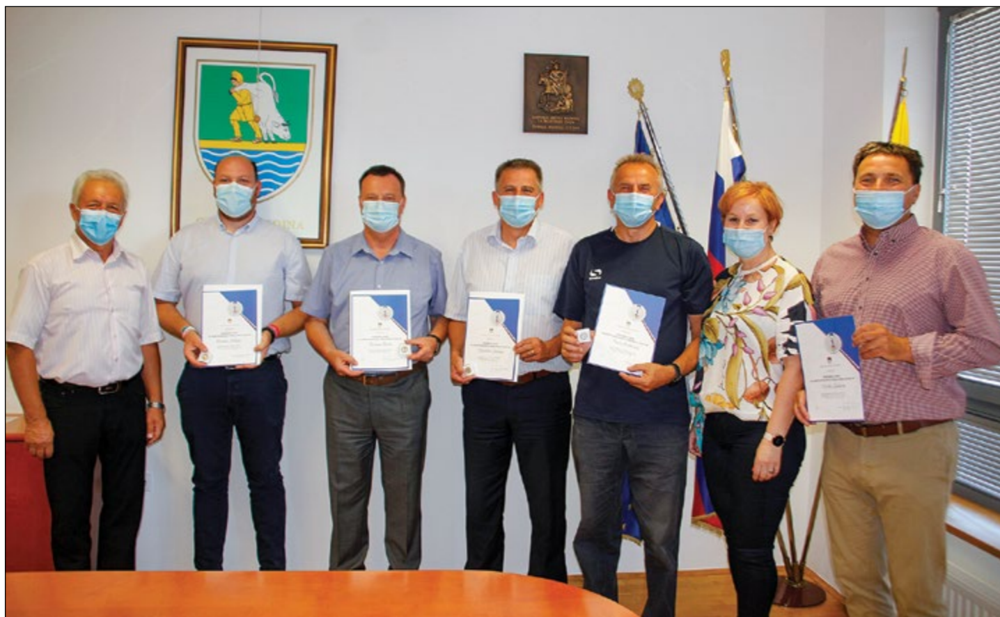
Prejemniki spominskega znaka Vlade RS v občini Hajdina