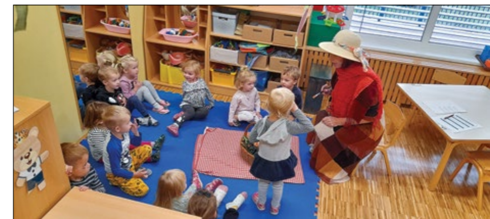
Otroke zelene igralnice je na prvi jesenski dan obiskala »gospa Jesen«, ki je naznanila jesenski čas in s polno košaro jesenskih pridelkov razveselila otroke.