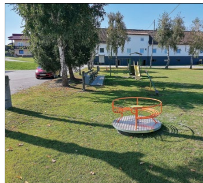
Vrtiljak v Slovenji vasi. V središču Slovenje vasi smo ob obstoječih igralih namestili vrtiljak - novo igralo za najmlajše obiskovalce parka