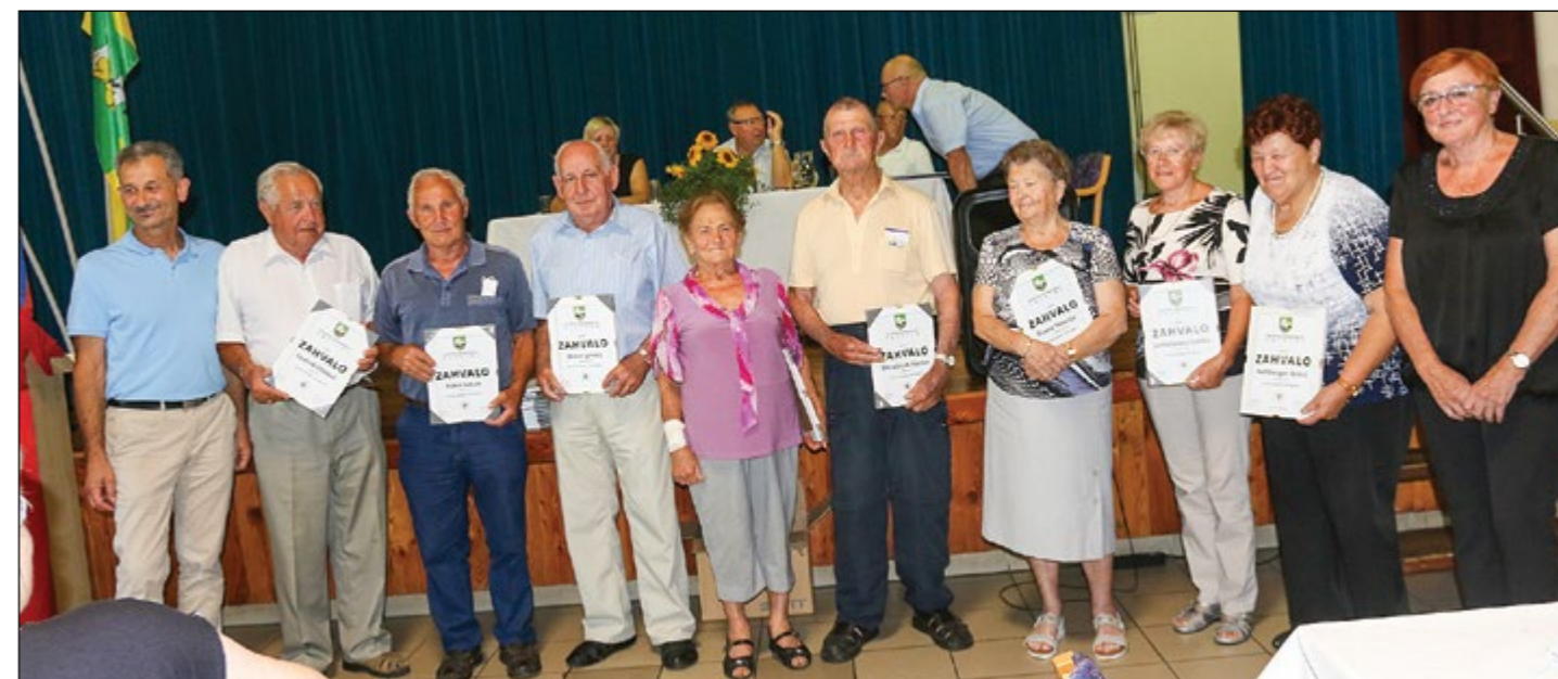
Prejemniki zahval za 20 let članstva v Društvu upokojencev Hajdina