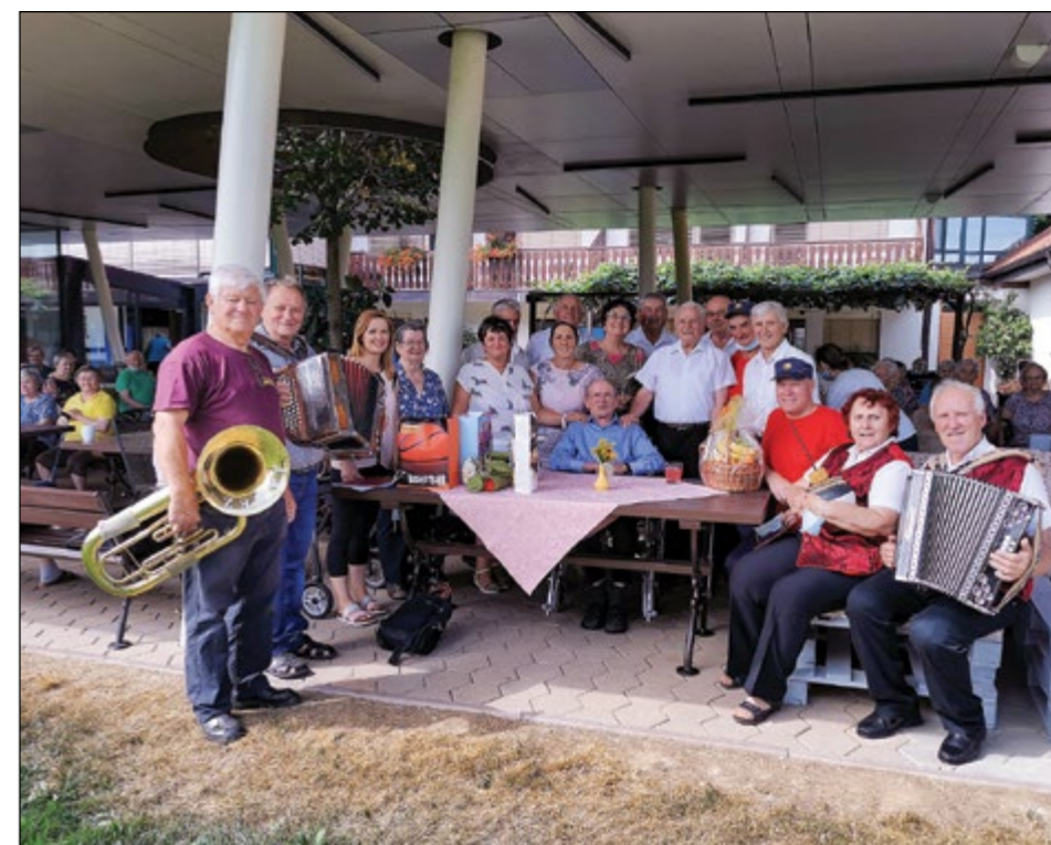
Ob koncu še skupinska fotografija v spomin na srečanje, kakršnih slavljenču želimo čim več.