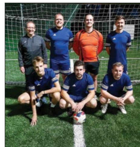
Draženci (člani) – 4. mesto