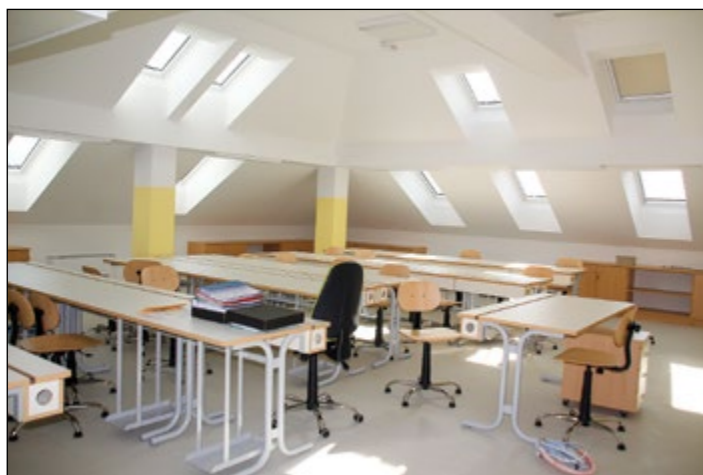
Končana so tudi obnovitvena dela na šolski mansardi.

Končana je izvedba rekonstrukcije podstrešja Osnovne šole Hajdina, ki jo je izvajalo podjetje AROL, d. o. o. Z izvedbo rekonstrukcije podstrešja je šola pridobila skoraj 400 kvadratnih metrov dodatnih prostorov – dodatno učilnico, multimedijško učilnico in knjižnico, uredil se je prehod med podstrešjem in novim delom šole, vgrajeno pa je tudi osebno dvigalo.