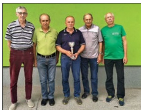
Kegljači DU Hajdina so bili uspešni na steznem kegljanju na Ptuju.