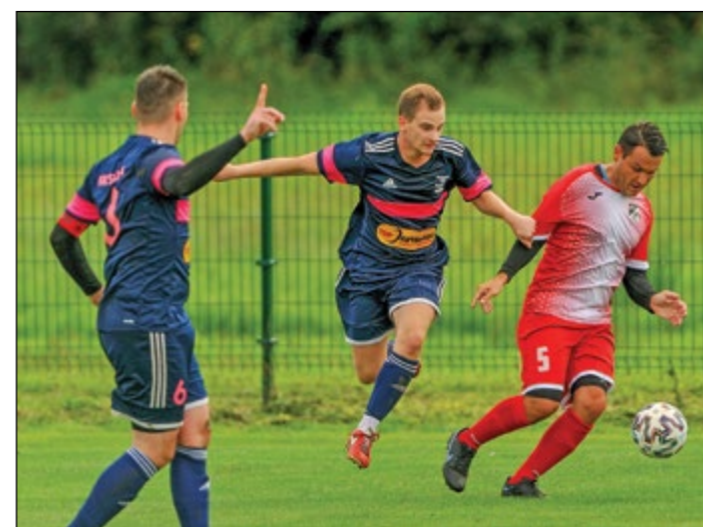
Nogometaši NK Skorba v akciji