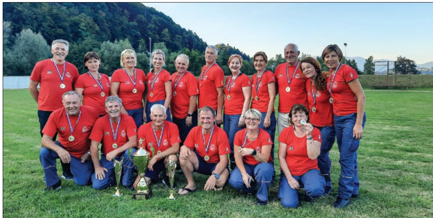
Članice B in člani B PGD Hajdoše imajo veliko razlogov za veselje, saj so znova stali na najvišji stopnički in osvojili nova odličja.