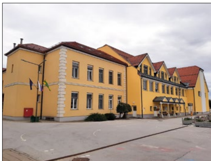
Energetska sanacija na OŠ Hajdina je končana.