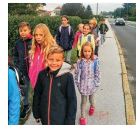
Nasmejani pešci iz Slovenje vasi