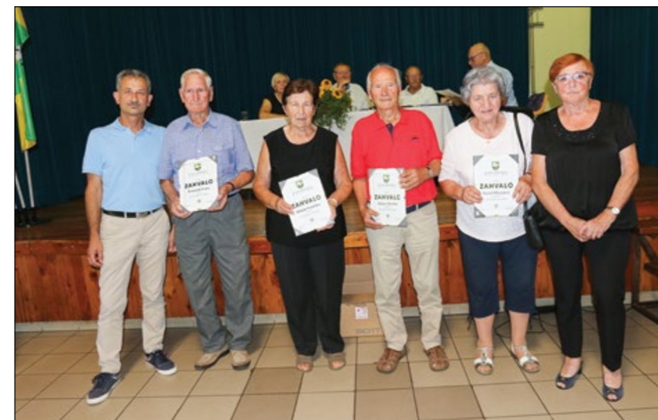
Prejemniki zahval za 30 let članstva