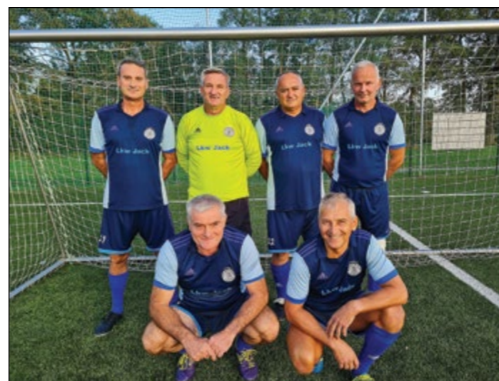
Hajdina (veterani nad 50 let) – 4. mesto