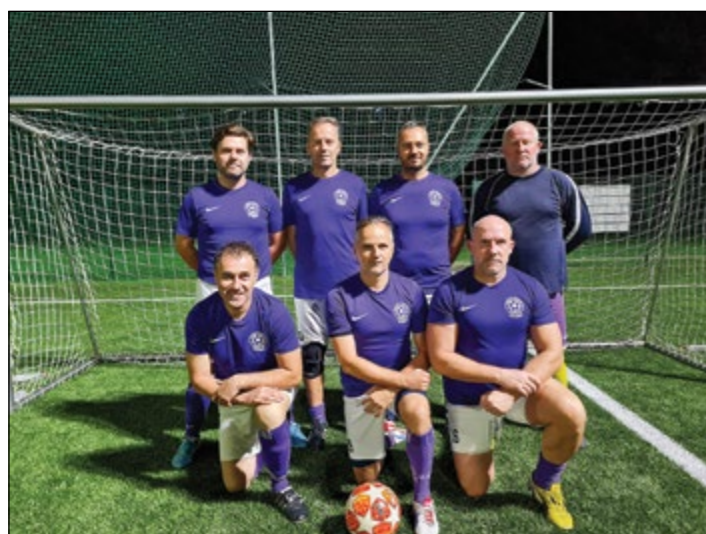
Gerečja vas (veterani nad 35 let) – 4. mesto