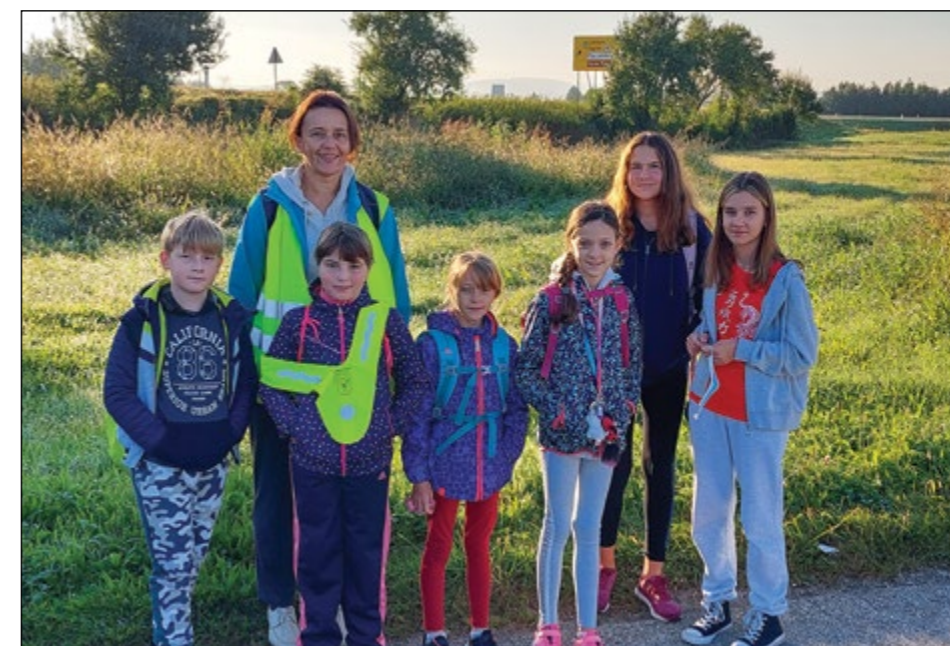
Učenci v spremstvu učiteljice, ko so prihajali z Zg. Hajdine.