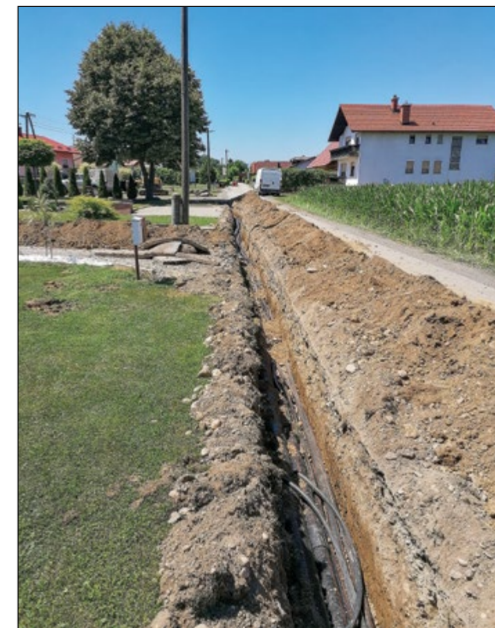
V naselju Draženci, na lokaciji Logar, Habrič in Zgornja Hajdina, potekata izgradnja javne razsvetljave in položitev zračnih NN-vodov v zemljo.

Ob zaključku projekta se posebej zahvaljujemo stanovalcem ob trasi izkopov za sodelovanje, razumevanje in predvsem za potrpežljivost (žal je ob izvajanju del prišlo do prekinitve TK-signalov).