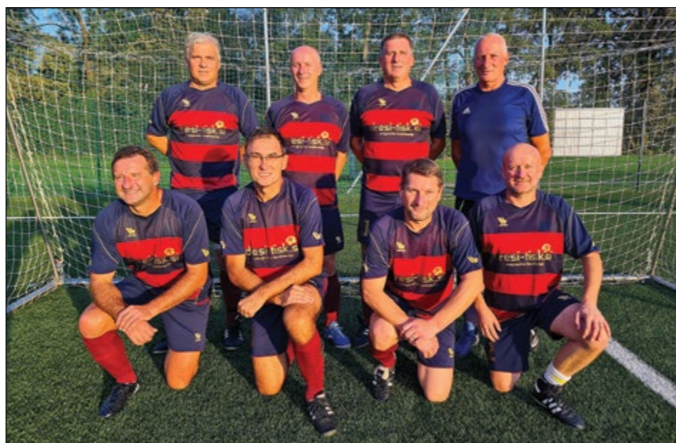
Hajdoše (veterani nad 50 let) – 1. mesto