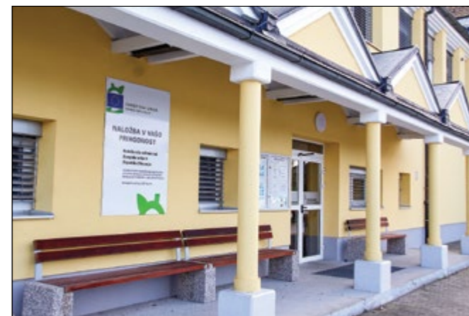
Energetska sanacija na zgradbi OŠ Hajdina, ki se je začela letos spomladi, je uspešno končana.

Projekt energetske prenove javnih objektov Občine Duplek in Občine Hajdina je izveden po principu javno-zasebnega partnerstva (JZP) v 15-letnem koncesijskem obdobju. Zasebni partner investira v energetska prenova objekta in zagotavlja določene prihranke ob enakem ali višjem udobju v prostorih, javni partner pa ga s temi prihranki v pogodbeni dobi poplača. Po poteku pogodbenega obdobja vsi prihranki pri stroških za oskrbo z energijo ostanejo javnemu parterju. Zasebni partner bo v času trajanja 15-letne koncesije zagotovil tudi upravljanje in vzdrževanje novovgrajenih oziroma saniranih energetskih naprav in sistemov. Energetska sanacija je že izboljšala bivalne pogoje, prispevala bo k prihranku energije in zmanjšala onesnaževanje okolja. Po pripravljenih izračunih bo sanacija prispevala k zmanjšanju toplogrednih plinov v višini 245 ton CO 2 letno, kar je enako količini CO 2 , ki bi jo letno vsrkalo 14.000 dreves ali 33 hektarjev gozda.