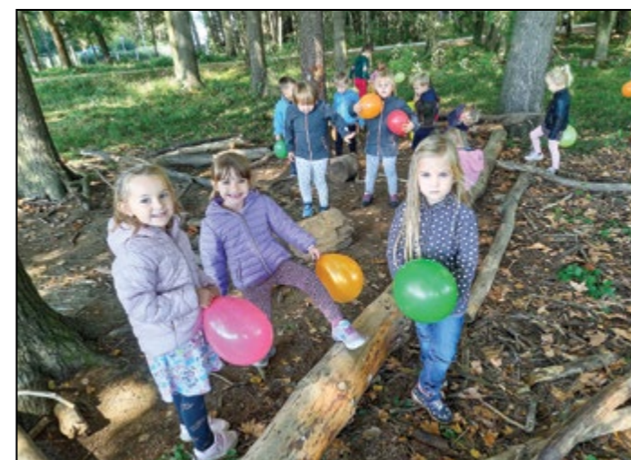
Otroci rumene igralnice so prvi jesenski dan praznovali z baloni v gozdu. Naši baloni so bili v barvah jeseni, kot jesensko listje.