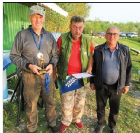
Drugo mesto za Hajdoše 1