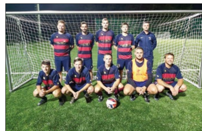
Hajdoše (člani) – 3. mesto