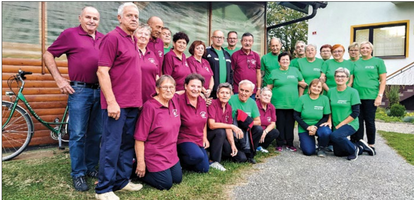
Kegljači DU Hajdina na kegljanju v Kidričevem

V septembru 2021 so potekala kegljaška tekmovanja, ki so se jih udeleževali tudi člani Društva upokojencev Hajdina. V uredništvu smo dobili kar dve fotografiji.