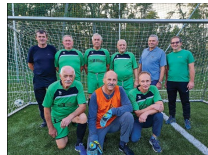
Draženci (veterani nad 50 let) – 5. mesto