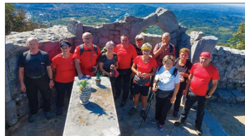
Hajdinski planinci na Sabotinu.

V jesenskih mesecih se nam pridružite na krajših pohodih. Odpravljamo se na nočni pohod na Donačko goro, imeli bomo tudi kostanjev piknik. Pridite, skupaj nam bo lepše!