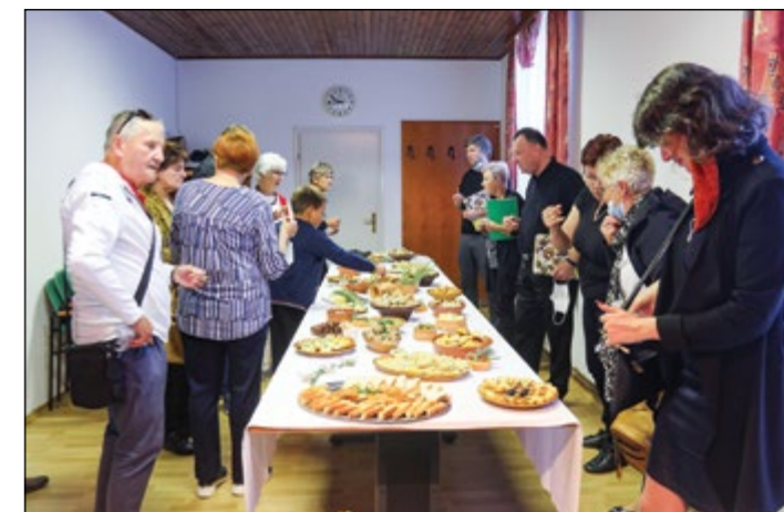
Sledila je pokušina rimskih jedi