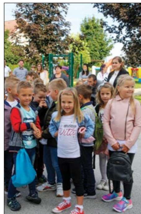
1. september na OŠ Hajdina