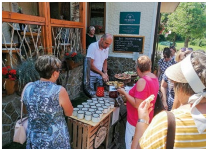
Na turistični in eko kmetiji pri Baronu so Dražčankam ponudili zdravo hrano in napitke.