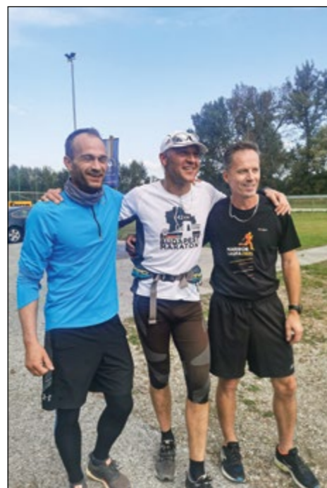
Najboljši trije tekači v moški konkurenci