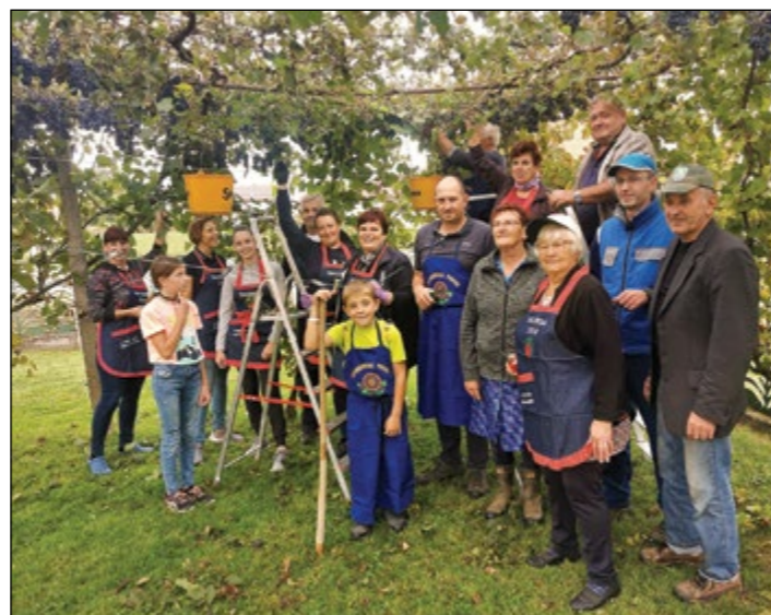
Pod Zelenkovimi brajdami je bilo tudi letos delovno, saj je tam potekala skorbovska vaška trgačev.