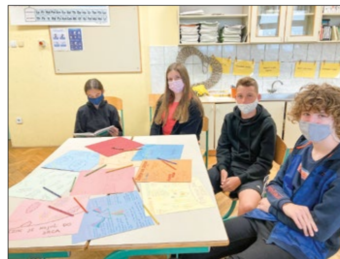
Devetošolci pri pouku slovenskega jezika

V petek, 24. septembra, smo v šoli obeležili evropski dan jezikov. To je dan, ko praznujemo jezikovno raznolikost v Evropi in spodbujamo vseživljenjsko učenje jezikov v šoli in izven nje. Učiteljice tujih jezikov smo za učence pred knjižnico pripravile predstavitev jezikov in jezikovni kviz, učenci pa so pri pouku angleščine iskali besede za pozdrave v različnih jezikih in na podlagi slušnih posnetkov ugotavljali, za kateri jezik gre.