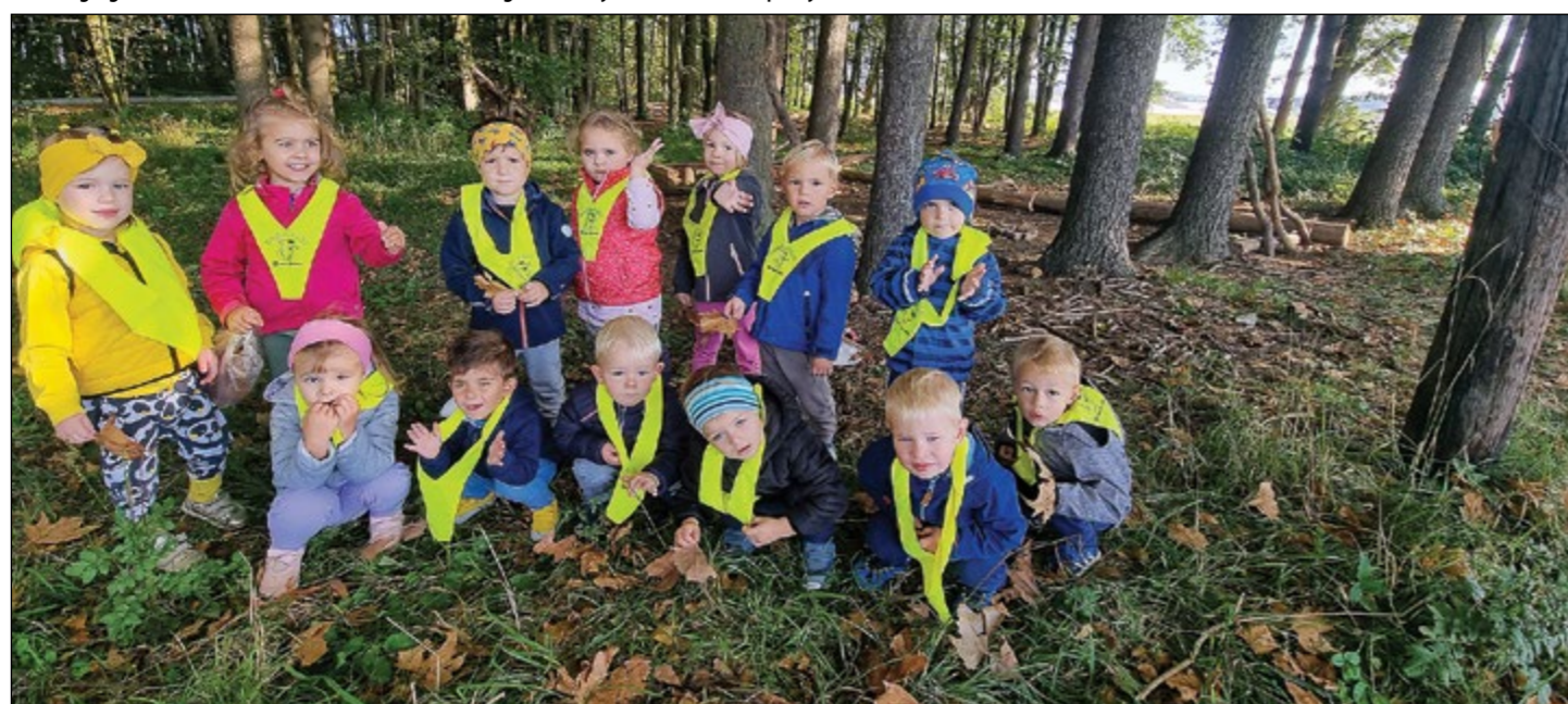
Igra otrok modre igralnice v gozdičku na lep prvi jesenski dan