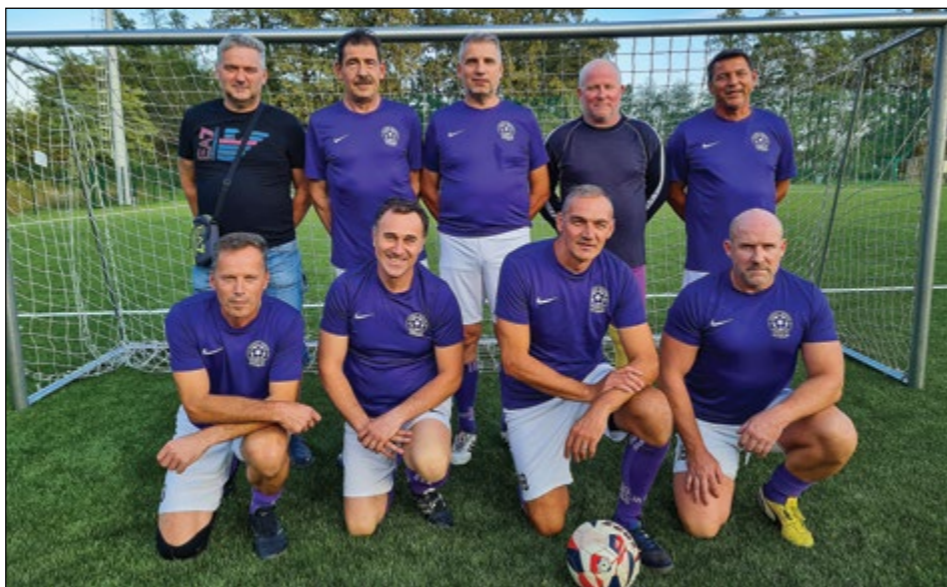
Gerečja vas (veterani nad 50 let) – 1. mesto