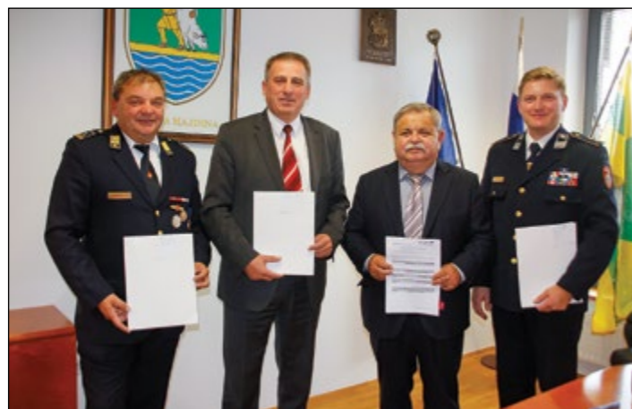
V občini Hajdina je bil podpis pripravljene projektne vloge partnerjev, ki se skupaj prijavljajo na razpis Interreg Slovenija - Hrvaška s projektom Varno ob Dravi.