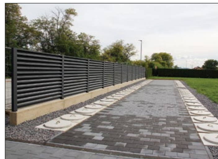
Dela potekajo na hajdinskem pokopališču, kjer je izgrajeno novo žarno polje, ki nudi 14 dvojnih in 27 enojnih žarnih niš.

Do novega žarnega polja je izvedena tlakovana potka. Začela se je tudi zamenjava ograje iz dotrajanih cipres z lamelno ograjo, ki smo jo postavili pri novem žarnem polju. Zamenjavo cipres bomo nadaljevali postopoma.