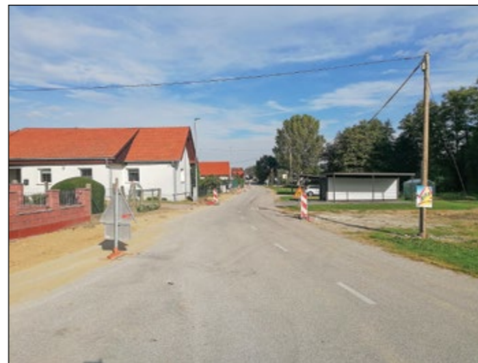
Na Spodnji Hajdini poteka izgradnja pločnika, na odcepu kapela–glavna cesta.

Vse občane, ki so še priključeni na bakreno omrežje, zato prosimo, da se priključijo na tako imenovano optiko, kajti šele takrat bo Telekom odstranil zračne vode.