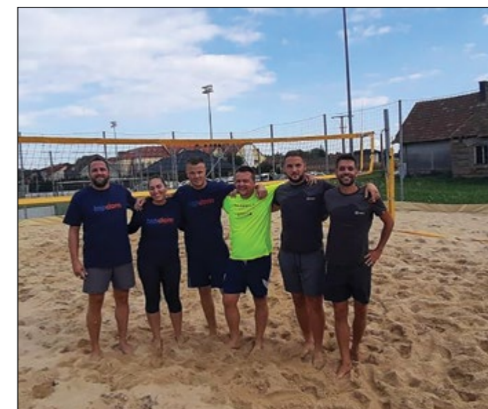
Ekipi Hajdine in Gerečje vasi III