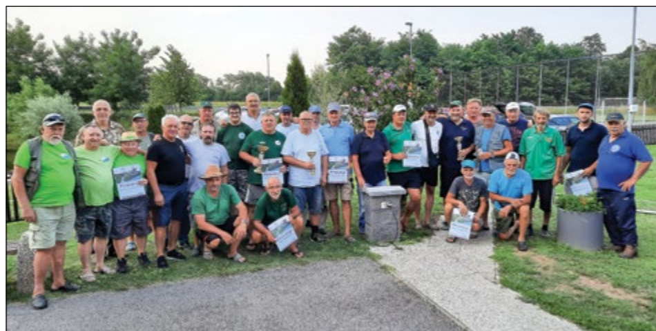
Skupinski posnetek udeležencev ribiškega srečanja ob draženskem ribniku

nenšek: »Lani, ko smo osvojili drugo mesto, sem rekel, da to niti ni tako slabo in bomo naslednje leto lahko samo še boljše. To se je tudi zgodilo, saj smo zmagovalci omenjenega druženja. Hvala vsem, da so se odzvali našemu povabilu. Naslednje leto se spet srečamo stari ribiški prijatelji v naši Draženski jami.«