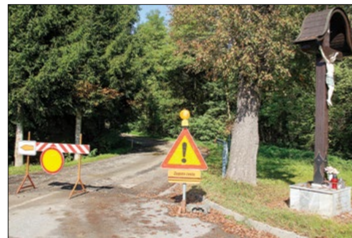
Delavci Cestnega podjetja Ptuj že izvajajo rekonstrukcijo ceste križ–Gerečja vas.

V septembru je bila na Ministrstvo za okolje in prostor poslana vloga za pridobitev odločitve glede izvedbe celovite presoje vplivov na okolje. Če bo ministrstvo za okolje in prostor izdalo odločitev, da je treba izvesti celovito presojo vplivov na okolje, bomo začeli postopek izdelave celovite presoje vplivov na okolje, sočasno pa bo izdelan tudi osnutek sprememb in dopolnitev Občinskega prostorskega načrta Občine Hajdina, prve spremembe in dopolnitve. Oba dokumenta bosta po izdelavi javno objavljena. Tej fazi sledijo še izdelava dopolnjene osnutka, izdelava predloga sprememb in dopolnitev OPN ter izdelava usklajenega predloga sprememb in dopolnitev OPN.