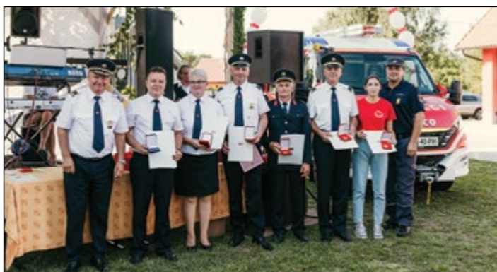
Prejemniki najvišjih gasilskih odlikovanj, namesto nekaterih nagrajencev so odlikovanja sprejeli njihovi družinski člani.