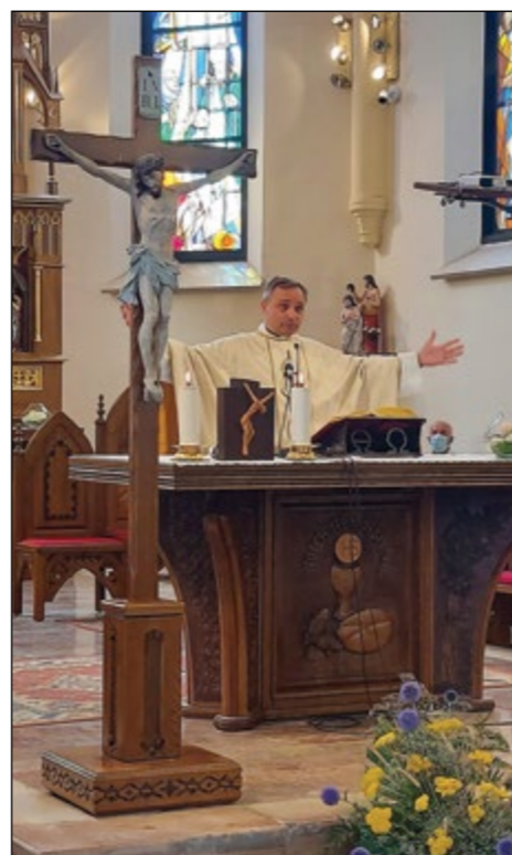
Utrinek s srebrnomašne slovesnosti v Martinovi cerkvi na Hajdini