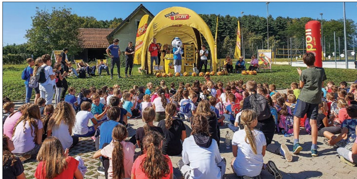
Veseli zaključek športnega dne

V četrtek, 23. septembra, smo se na OŠ Hajdina pridružili evropskemu dnevu športa in organizirali športni dan za učence od 1. do 9. razreda. Glavna dejavnost tega sončnega dne so bile tekaške vsebine.