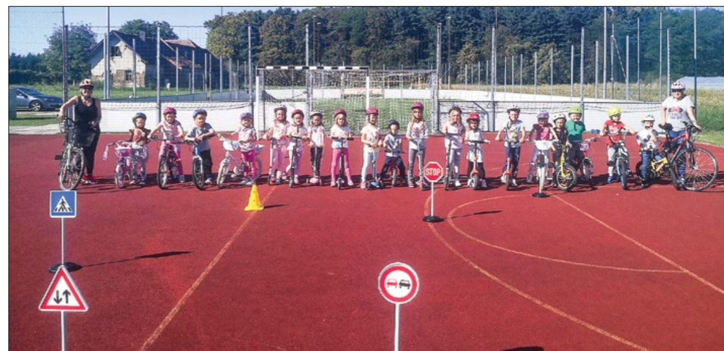
Otroci in vzgojiteljice rdeče igralnice so se kot kolesarji preizkusili na poligonu.