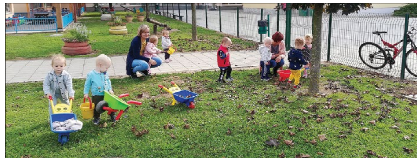
Najmlajši otroci iz oranžne igralnice so na igrišču vrtca opravili prvo jesensko opravilo, saj so grabljali in pobirali odpadlo listje.