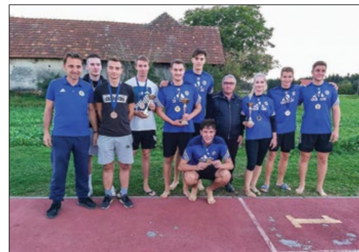
Skupinska fotografija najboljših ekip