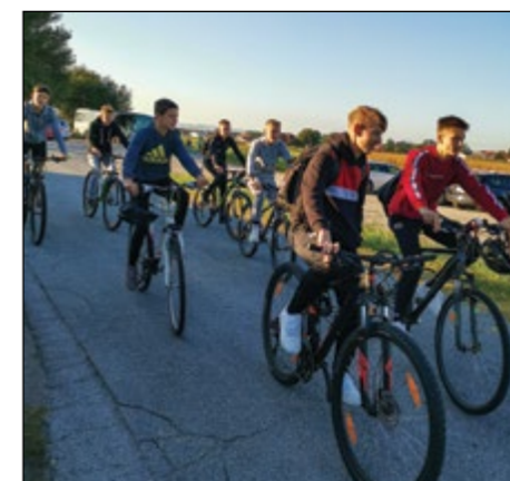
Tudi na kolesu je prijetno.