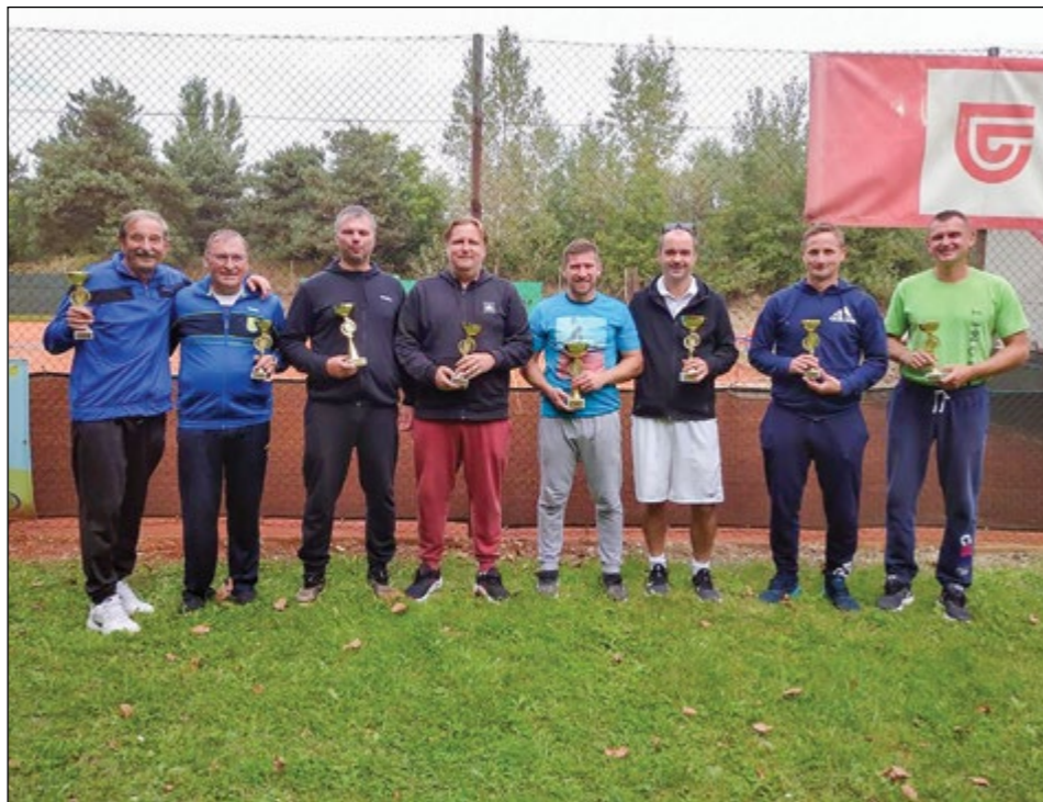
Prejemniki pokalov turnirja v tenisu (pari) 2021